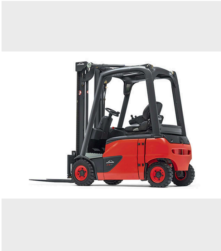
Vehículo de referencia